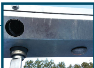
I portens tak finns ljus, såväl som ljus för riktningar.