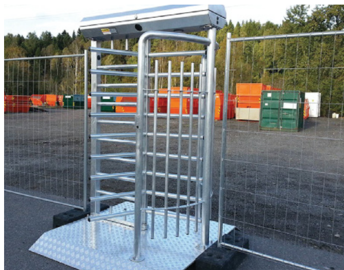
Produkterna på bilden kan vara extrautrustade