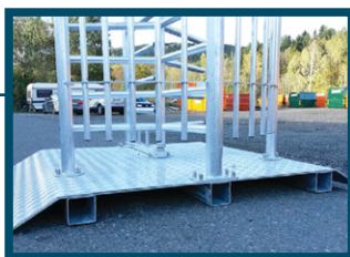
Leverans som standard med stålplattan. Finns med skivan eller plattan som har öppningen för elbilen (som på bilden)